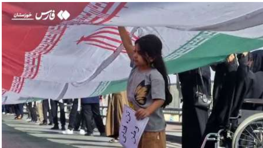
Une chaîne humaine s'est formée sur le pont blanc d'Ahvaz après les menaces de Donald Trump de cibler les ponts et les infrastructures en Iran.