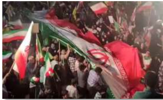
بخش دیپلماسی عمومی