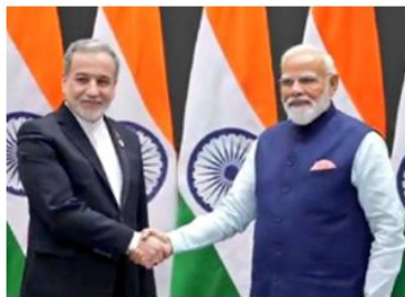
بدر عبدالعاطی وزیر امور خارجه مصر