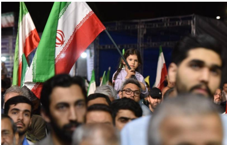
بخش دیپلماسی عمومی سفارت جمهوری اسلامی ایران در فرانسه