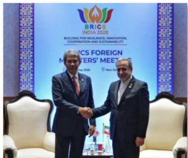
سیهاساک پوانکتکائو وزیر امور خارجه تایلند