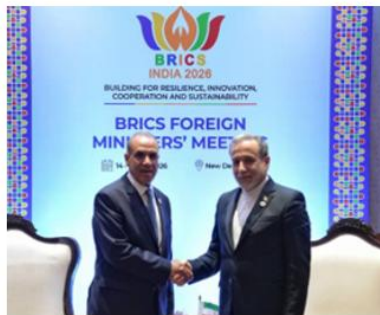
ویبرا وزیر امور خارجه برزیل