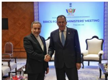
محمد حسن وزیر امور خارجه مالزی