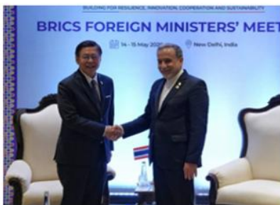
سیهاساک پوانکتکائو وزیر امور خارجه تایلند