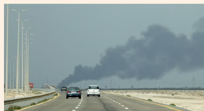
Gulf states are concerned that once the war ends, they will be left with a wounded but more hawkish Iran on their doorstep

European nations swing behind idea discussed with Riyadh to model agreement on 1970s Helsinki process